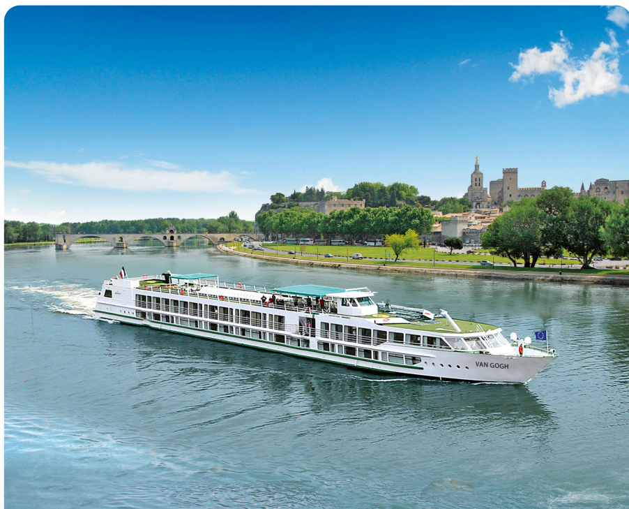
Le Rhône provençal et la Camargue - Bateau 5 Ancres !